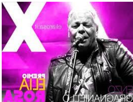
X EDIZIONE 2016 Direttore artistico: ENZO GRAGNANIELLO