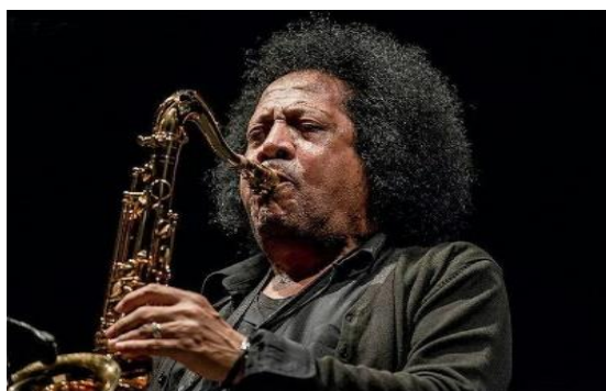
XI EDIZIONE 2017 Direttore artistico: JAMES SENESE